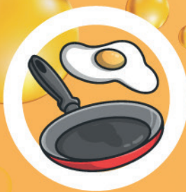
OLEJ ZE SMAŻENIA