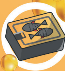
OLEJ Z PUSZEK