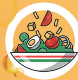
OLEJ Z SAŁATEK